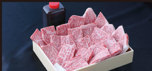
D 特選ロース 平野幸一之牛最高部位。この肉質でこの値段! 約 1kg 入 ¥15,450 / 税別 (¥16,686 税込)