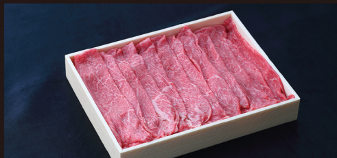
E すき焼き しゃぶしゃぶ用 (並) お肉の旨味そのものを感じる部位。 約 600g 入 ¥5,150 / 税別 (¥5,562 税込)