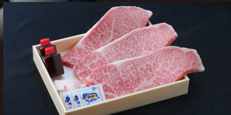
B サーロインステーキ きめ細かく綺麗なサシが特徴。幅広い世代におすすめです。 約 200g×3枚 ¥9,400 / 税別 (¥10,152 税込)