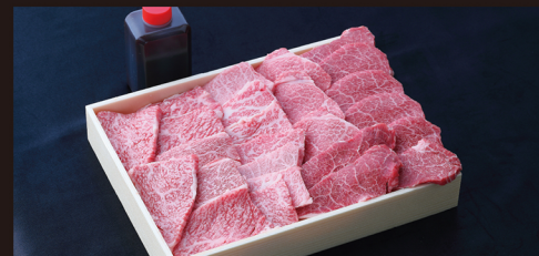
K 焼肉セット (モモ・バラ肉) バーベキュー等リーズナブルに決めるならこちら! 約 600g 入 ¥5,080 / 税別 (¥5,486 税込)