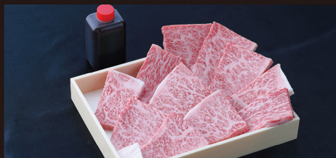
C 特選ロース 平野幸一之牛最高部位。ぜひご賞味いただきたい逸品! 約 600g 入 ¥9,400 / 税別 (¥10,152 税込)