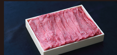
H すき焼き しゃぶしゃぶ用 (並) あっさりした旨味が強調され、赤身なのに柔らかい逸品です。 約 1kg 入 ¥8,400 / 税別 (¥9,072 税込)