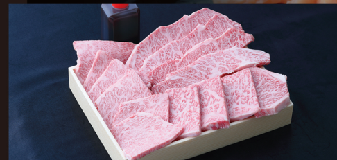
M 特選焼肉詰め合わせ (特選ロース・上ロース・特選カルビ) 焼肉薩摩自慢のお肉の決定版! 約 600g 入 ¥7,900 / 税別 (¥8,532 税込)