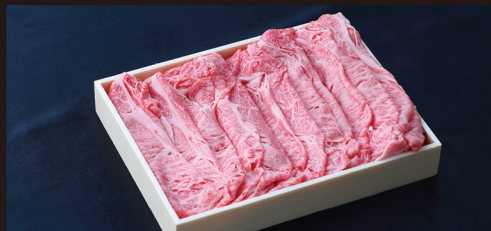
F すき焼き しゃぶしゃぶ用 (特上) 特上極上の味わいを是非ご賞味ください。 約 600g 入 ¥7,250 / 税別 (¥7,830 税込)