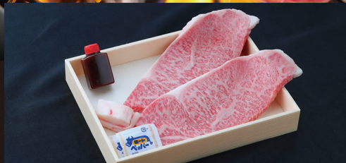
A サーロインステーキ 一度は食べていただきたい、お肉の王様サーロイン。 約 200g×2枚 ¥6,350 / 税別 (¥6,858 税込)