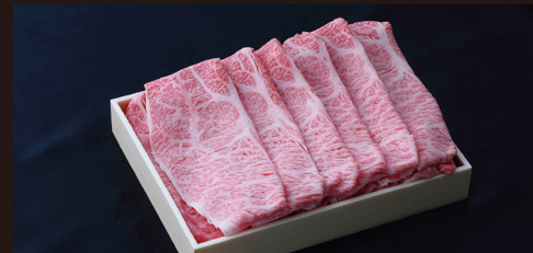
I すき焼き しゃぶしゃぶ用 (特上) サシが程良く分散していて、きめも細かく納得の味。 約 1kg 入 ¥11,900 / 税別 (¥12,852 税込)