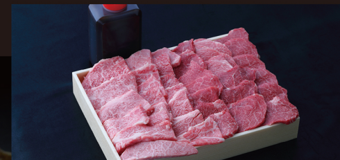
L 焼肉セット (モモ・バラ肉) 大人数のバーベキューにオススメ! 食べる人を笑顔に... 約 1kg 入 ¥8,250 / 税別 (¥8,910 税込)