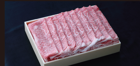
J すき焼き しゃぶしゃぶ用 (特選) 霜降り肉のきめ細かい肉質と濃厚な風味。口に入れるとトロけます。 約 1kg 入 ¥15,400 / 税別 (¥16,632 税込)