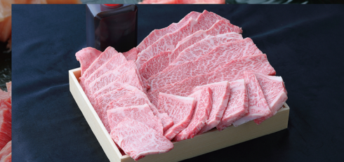
N 特選焼肉詰め合わせ (特選ロース・上ロース・特選カルビ) 特選黒毛和牛を心ゆくまで! 約 900g 入 ¥11,700 / 税別 (¥12,636 税込)