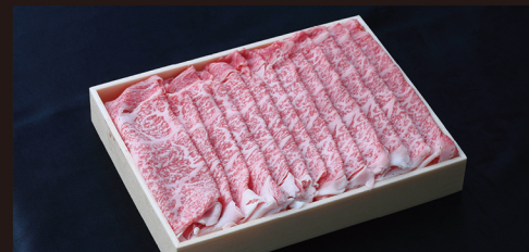
G すき焼き しゃぶしゃぶ用 (特選) 霜降り肉を存分に味わえる極上の肉質をどうぞ。 約 600g 入 ¥9,350 / 税別 (¥10,098 税込)

長崎県 雲仙岳の麓。 「人に愛される肉を」と想いを込めて一頭一頭、丹精込めて... こだわりの特選黒毛和牛をお召し上がりください。